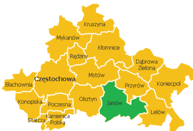
Rysunek 1. Gmina Janów w powiecie częstochowskim

Gmina Janów zajmuje powierzchnię 146 km 2 i położone jest na południowym krańcu powiatu częstochowskiego. Jednostka stanowi 9,6% powierzchni powiatu. Według danych z 2013 roku Gmina liczy 5 993 mieszkańców, a gęstość zaludnienia to w przybliżeniu 41 osób/km 2 . Siedziba Jednostki położona jest o 24 km na wschód od centrum Częstochowy, a także w niewielkiej odległości od aglomeracji miejskiej Katowic. Jednostka graniczy z gminami powiatu częstochowskiego: Olsztyn od zachód, Mstów i Przyrów od północy, Lelów od wschodu oraz z gminami powiatu myszkowskiego Niegowa i Żarki od południa.